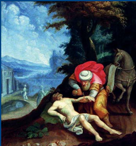
"Der erste "Diakon" - Der barmherzige Samariter, Nordempore der Stadtkirche Celle.