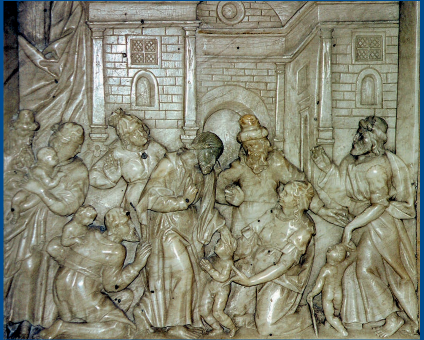
Taufstein in der Stadtkirche Celle: Jesus segnet die Kinder

Ein anderer Weg ist die Stille. Oft begegne ich in unserer Stadtkirche St. Marien Menschen, die im Raum der Stille Gott nachspüren, mit ihm im Gespräch sind. Manchmal hadern sie auch mit Gott oder sich selbst. Der Raum der Stille bietet die Möglichkeit, ganz für sich den eigenen Gedanken nachzu-