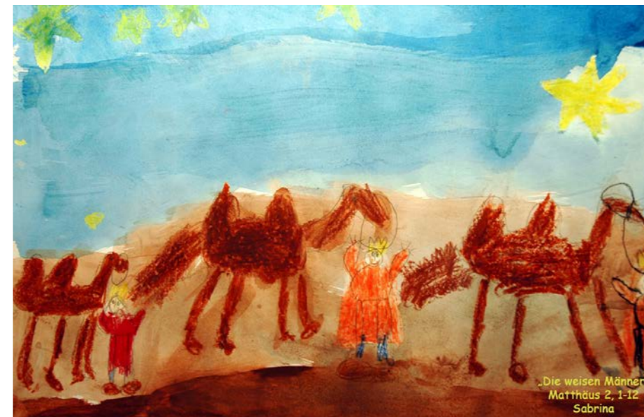
Die weisen Männer – Celler Kinderbilderbibel von 2005

Taufen und Trauungen: Anfragen und Anmeldungen im Gemeindebüro Haus- und Krankenabendmahl: telefonische Vereinbarung mit dem Pfarramt Beerdigungen: Meldung durch die Beerdigungsinstitute an das Pfarramt Information zum Konfirmandenunterricht: Pastorin Elisabeth Schwenke