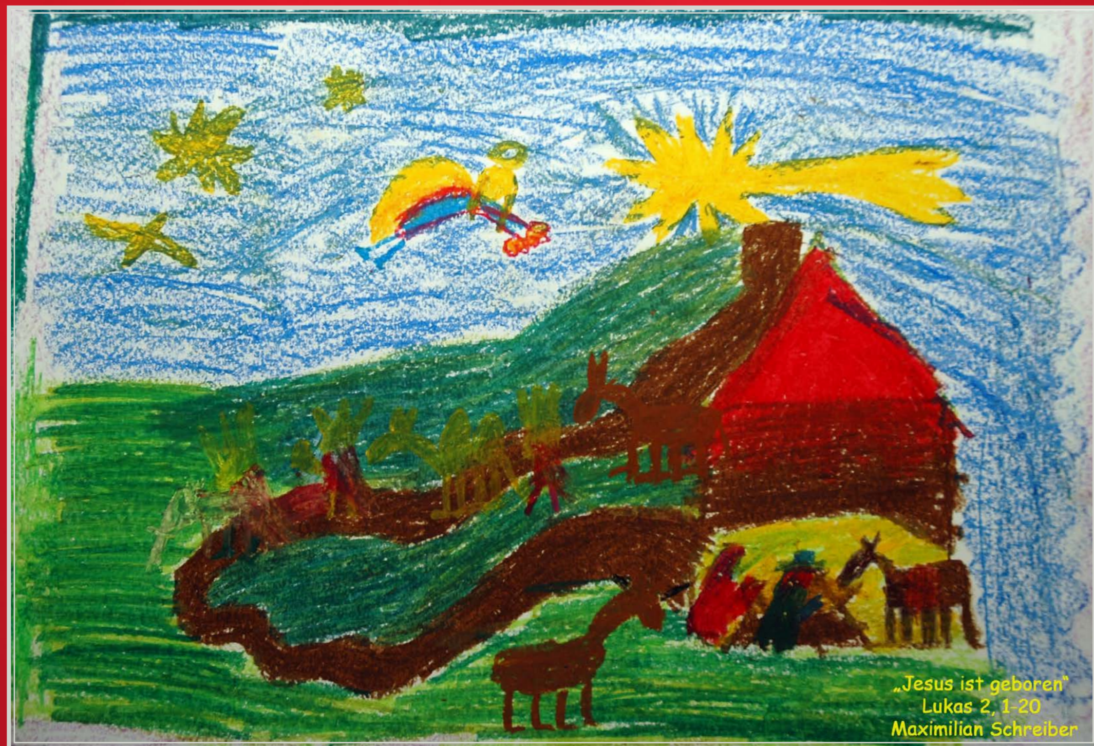
„Jesus ist geboren“ Lukas 2, 1-20 Maximilian Schreiber

Christi Geburt – Celler Kinderbilderbibel von 2005