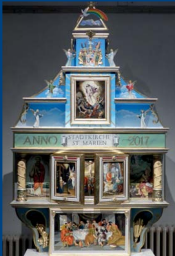
Kinderaltar im Südschiff der Stadtkirche Celle